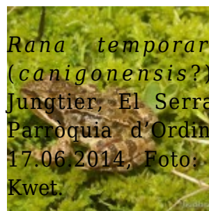
Rana temporaria Lebensraum von ( canigonensis?), Calotriton asper, Rana Jungtier, El Serrat, temporaria Parròquia d'Ordino, ( canigonensis?) und 17.06.2014