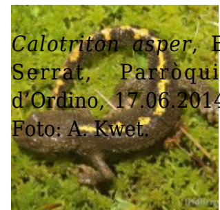
Calotriton asper, El Serrat, Parròquia d'Ordino, 17.06.2014