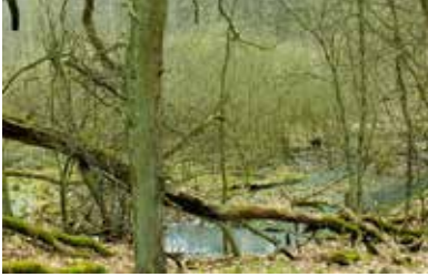
Überwinterungsgewässer von E. orbicularis