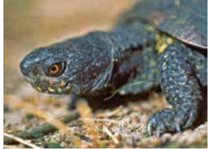
Männliche Emys orbicularis mit roter Irisfärbung