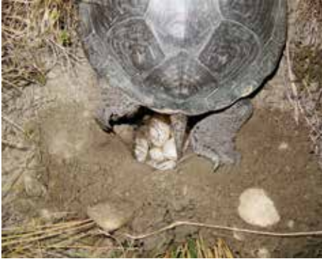
Ein Weibchen bei der Eiablage

Der Beginn der Eiablage ist fast im gesamten europäischen Verbreitungsgebiet erstaunlich konstant, wobei in Mittel- und Osteuropa meist nur ein Gelege, im Süden des Verbreitungsgebiets aber bis zu drei Gelege abgesetzt werden können.