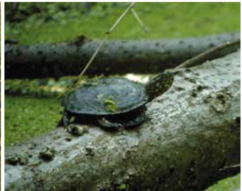
Ein Jungtier im Fadenbach (Nationalpark Donau-Auen) beugte die Umgebung