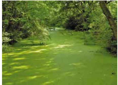
Altarm im Nationalpark Donau-Auen (Fadenbach)

Regelmäßig werden zweifelhafte Angaben über das Vorkommen von Europäischen Sumpfschildkröten aus verschiedenen Bundesländern gemacht, selbst im alpinen Bereich. Jüngst durchgeführte Untersuchungen an Europäischen Sumpfschildkröten in Vorarlberg, wo Reliktvorkommen erwartet werden könnten, ergaben jedenfalls, dass die Art dort heute als ausgestorben gelten muss. Auch Einzelexemplare aus Kärnten erwiesen sich nach neueren molekulargenetischen Untersuchungen als gebietsfremd (allochthon). Trotzdem kann ein natürliches Vorkommen außerhalb der Donau-Auen im Burgenland, in der Südsteiermark sowie in Südkärnten nicht ausgeschlossen werden, besonders wenn man die Fähigkeit der Europäischen Sumpfschildkröte in Betracht zieht, dass sie zumindest Strecken bis zu 1 km und mehr über Land bewältigen und ihr Migrationsverhalten bei entsprechenden Wassernetzen sehr ausgeprägt sein kann.