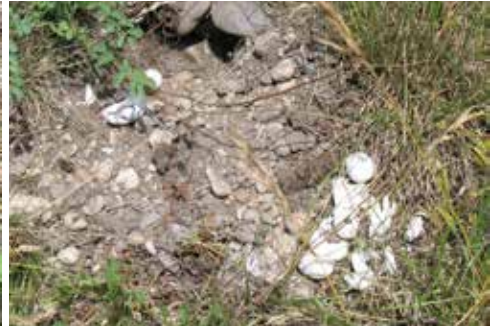
Ein von Fressfeinden geplündertes Gelege