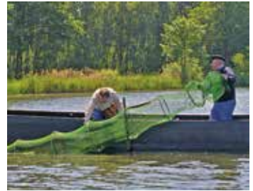
Die Reusenfischerei ist eine potenzielle Gefahr für die Schildkröten

auch in Nordostdeutschland erheblich durch den Fang zu Speisezwecken dezimiert beziehungsweise sogar ausgerottet wurden. Heute unvorstellbar – da die katholische Kirche in der Fastenzeit den Verzehr von den im Wasser lebenden Schildkröten (die folglich „Fisch“ sind) erlaubte, gab es noch vor 300 Jahren in Preußen eine gewerbsmäßige Ausbeutung und einen schwunghaften Export der damals häufigen Europäischen Sumpfschildkröten als Fastenspeise!