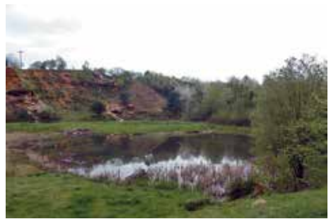
Wiederansiedlungsgebiet „Hölle von Rockenberg“ in der Wetterau, Hessen

Schon lange sind die historischen Vorkommen Europäischer Sumpfschildkröten in Deutschland mit wenigen Ausnahmen erloschen. Freilandstudien zeigten in den 1990er-Jahren für die Brandenburger Reliktpopulationen einen kritischen Zustand. Zur Rettung der überalterten und individuenarmen Populationen war ihre Stützung mit künstlich erbrüteten Gelegen unverzichtbar. Inzwischen stehen für Bestandsstützungen und Wiederansiedlungsvorhaben in Nordostdeutschland Nachkommen einer Erhaltungszucht,