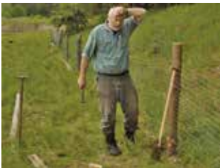
Einzäunen des Eiablageplatzes

plätze beispielsweise in Brandenburg seit Jahren während der Eiablagessaison aus größerer Distanz von erfahrenen Mitarbeitern des Schutzprojekts beobachtet. Sofern der gesamte Gelegeplatz (größere Fläche mit mehreren Gelegen) eingezäunt wird, ist der Zaun so zu stellen, dass die Schildkrötenweibchen ungehinderten Zugang haben. Letzteres ist alljährlich zu prüfen und gegebenenfalls nachzubessern. Die Einzäunung des Gelegeplatzes ist nicht grundsätzlich zu empfehlen und kann auch nachteilige Effekte (siehe unten) hervorrufen. Sie schützt die Nester vor allem vor Wildschweinen. Fuchs, Marder, Waschbär und eventuell weitere Arten finden trotzdem Zugang. Es empfiehlt sich daher auch bei eingezäunten Gelegeplätzen, Einzelgelege mit Maschendraht zu sichern. Ein nachteiliger Effekt der Einzäunungen ist die ungehinderte Entwicklung der Vegetation. Der fehlende Zugang äsender