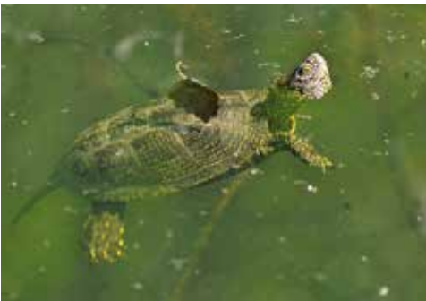
E. o. orbicularis (Verbreitungsgebiet Haplotyp IIa)

Tatsächlich ist die Informations- und Indizienlage rund um das Vorkommen der Europäischen Sumpfschildkröte in der Schweiz verworren, und auch historische faunistische Quellen zeichnen diesbezüglich kein klares Bild. Erschwerend kommt hinzu, dass die Europäische Sumpfschildkröte möglicherweise bereits in prähistorischer Zeit, sicher aber im Mittelalter als Handelsware – sie galten als Fastenpeise – in die Schweiz eingeführt und mit hoher Wahrscheinlichkeit auch freigesetzt wurde. Zusätzlich kompliziert wird eine Beurteilung der Situation heute auch durch die zwischen 1950 und 1980 an verschiedenen Orten durchgeführten