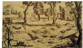
Schildkrötenteich aus HONBERG, W.H. (1682): Georgica curiosa, Aediliges Land- und Feldleben . - Ausgabe Martin Endes, 1701, Nürnberg

Noch vor wenigen Jahrhunderten war die Europäische Sumpfschildkröte in Mitteleuropa weit verbreitet. Schon prähistorisch hat sie in einigen Regionen die Nahrungspalette der Menschen bereichert. Darüber hinaus dienten ihre Panzer als Gebrauchsgegenstände und fanden unter anderem als Schüsseln oder Kehrschaufeln Verwendung. Vor allem aus dem 17. und 18. Jahrhundert belegen zahlreiche Quellen, dass die Bestände sowohl im süddeutschen Raum als