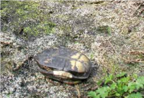
Diese Europäische Sumpfschildkröte wurde von einem Waschbär getötet

Seit etwa 10–12 Jahren finden sich in den letzten Vorkommen heimischer Sumpfschildkröten zunehmend geplünderte Nester, verletzte Tiere und Überreste gefressener Sumpfschildkröten. Diese Beobachtungen sind nur zum geringen Teil den zahlenmäßig gewachsenen Populationen heimischer Prädatorenarten wie Wildschwein, Fuchs und Dachs zuzuschreiben. Der inzwischen als „Schildkrötenkiller“ bedeutendste Fressfeind einheimischer Sumpfschildkröten ist der Waschbär, der sich seit Ende der 1990er-Jahre auch in Norddeutschland mit zunehmender Häufigkeit ausbreitet. Aufgrund seiner ausgesprochenen Lernfähigkeit und optimierten Jagd- und Sammeltechnik im Flachwasser ist der Waschbär in der Lage, sich sehr schnell lokale Sumpfschildkrötenbestände aller Altersklassen als Nahrungsressource zu erschließen. Darüber hinaus findet er auch Gelegeplätze und plündert die Nester. Dieselbe Bedrohung geht von dem etwa zeitgleich eingewanderten Marderhund (Ursprungsgebiet Ostasien) aus.