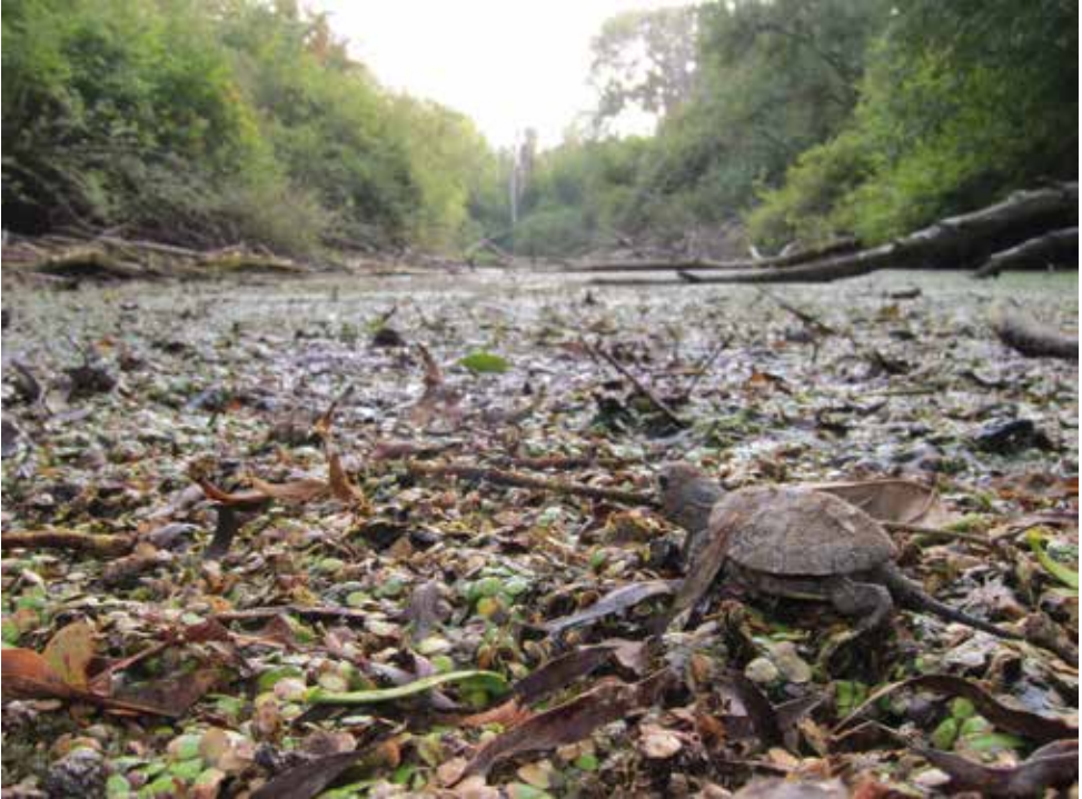
Ein Schlüpfing verlässt seine Gelegehöhle im Nationalpark Donau-Auen