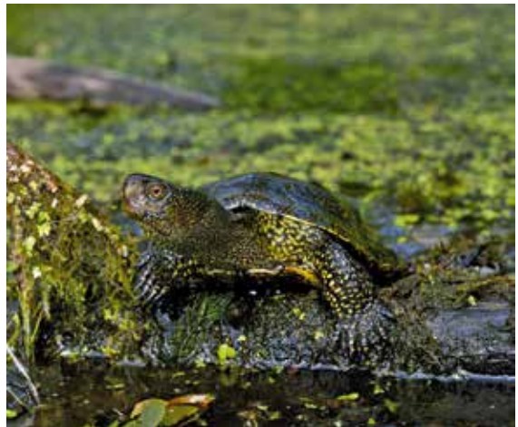
Die Europäische Sumpfschildkröte erfreut sich auch in der Bevölkerung einer gewissen Popularität

Im Gegensatz zu anderen Reptilienarten erfreut sich die Europäische Sumpfschildkröte in der Bevölkerung einer gewissen Popularität und stößt bei einem weiten Kreis von Schildkrötenhaltern auf großes Interesse. Entsprechend vielfältig und zahlreich waren und sind denn auch die Bestrebungen, diese attraktive Schildkröte in verschiedenen Gewässerkomplexen anzusiedeln oder wiederanzusiedeln. Grundsätzlich begrüßt die Karch diese Bemühungen, setzt sich aber vehement dafür ein: