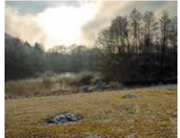
Eine Abdeckung der Nester mit Nadelbaumreisig schützt vor Frostschäden

In Mitteleuropa überdauern die Schlüpflinge ihren ersten Winter oft in den Nesthöhlen. In dieser Zeit können harte Fröste ohne Schnee (Kahlfröste) den gesamten Reproduktionserfolg der Saison zunichte machen. Es empfiehlt sich daher, die Nester von Mitte November bis etwa Mitte März des Folgejahres mit einer dicken Packung Nadelbaumreisig (Kiefer oder Fichte) abzudecken.