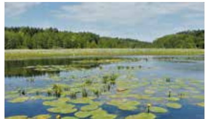
Lebensraum der Europäischen Sumpfschildkröte in Brandenburg