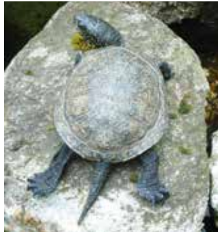
Charakteristisch für E. orbicularis ist der lange Schwanz