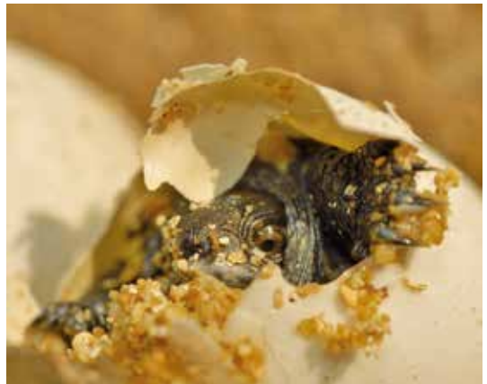
Schlupf einer kleinen Europäischen Sumpfschildkröte

Im gesamten Verbreitungsgebiet scheint es zwei verschiedene Schlupfstrategien der Jungtiere zu geben: Entweder verlassen die kleinen Schildkröten schon im September desselben Jahres die Nesthöhle oder sie überwintern, bereits geschlüpft, in der Gelegegrube und verlassen diese erst im Frühjahr des darauffolgenden Jahres. Liegen die Eiablagestellen der Weibchen weit vom Gewässer entfernt, kann man die Jungtiere nach dem Schlupf ebenfalls auf erstaunlich weiten Überlandwanderungen antreffen.