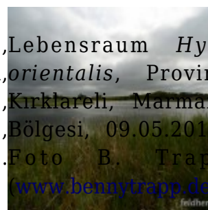
Lebensraum Hyla orientalis, Provinz Kirklareli, Marmara Bölgesi, 09.05.2013