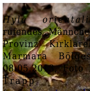
Hyla orientalis, rufendes Männchen, Provinz Kirklareli, Marmara Bölgesi, 08.05.2013