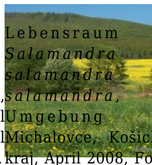
Lebensraum Salamandra salamandra

Umgebung Košice, Košický kraj, April 2008, Foto T. Pröhl ( www.fokus-natur.de ).