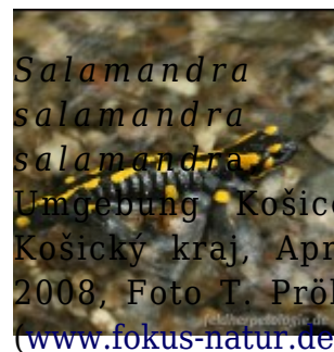
Salamandra salamandra salamandra

Umgebung Košice, Košický kraj, April 2008, Foto T. Pröhl ( www.fokus-natur.de ).