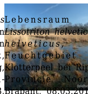
Lebensraum Lissotriton helveticus helveticus , Feuchtgebiet Klotterpeel bei Rips, Provincie Noord- Brabant, 08.03.2014,