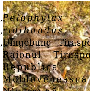
Pelophylax ridibundus, Umgebung Tiraspol, Raionul Tiraspol, Republica Moldovenească 12.05.2007