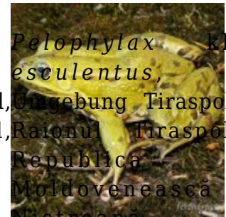
Pelophylax kl. esculentus, Umgebung Tiraspol, Raionul Tiraspol, Republica Moldovenească 12.05.2007